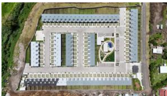
VISTA EN PLANTA

Se deberá anexar ilustraciones fotográficas del avance de obra y el programa de trabajo durante el período.