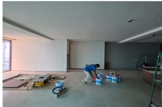
Aplicación de mano de pintura en apartamento