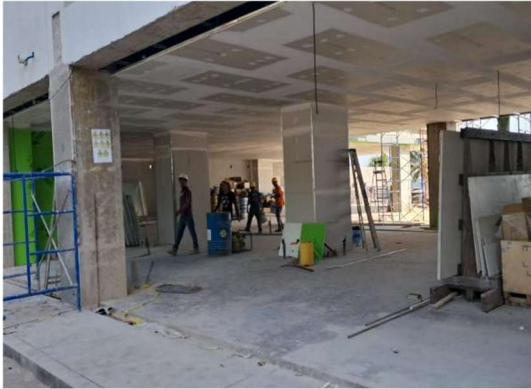
Forros de áreas comunes

Se deberá anexar ilustraciones fotográficas del avance de obra y el programa de trabajo durante el período.