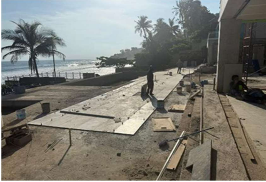
Instalación de piso en nivel 1.