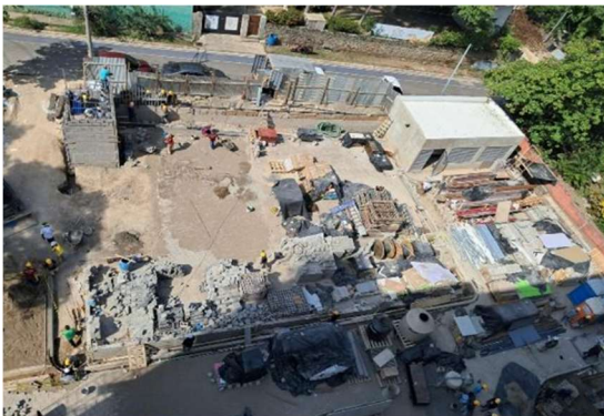
Avance de cuarto eléctrico