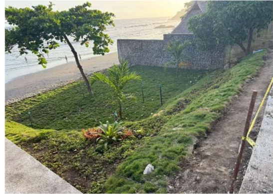
Inicio de jardinería