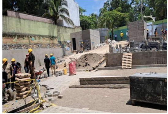
Avance de adoquín