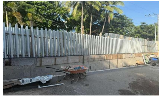
Cerramiento de verja perimetral