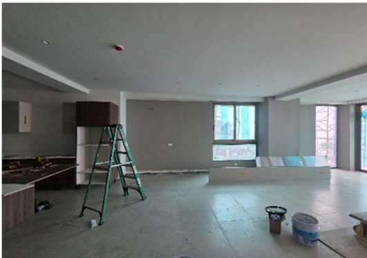
Aplicación de mano de pintura en apartamento