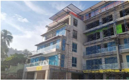
Cerramiento de vidrio de niveles