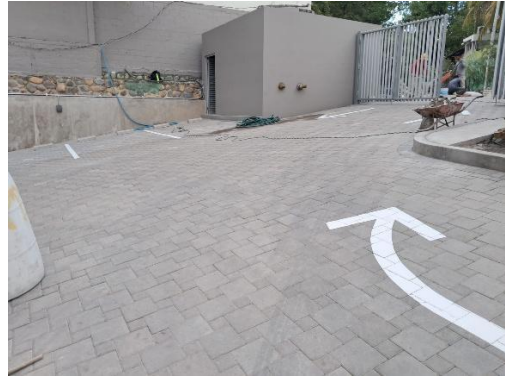
Instalación de señalización horizontal.