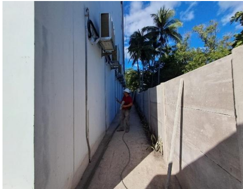
Instalación de aires acondicionados en nivel 1