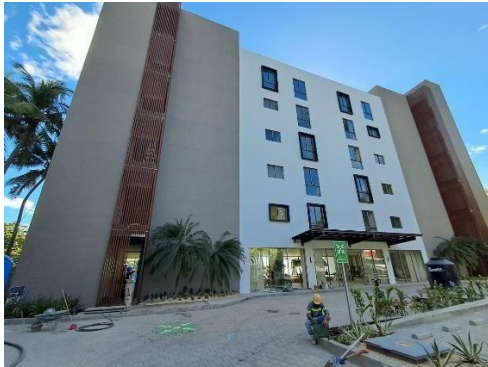
Aplicación de pintura en fachada principal