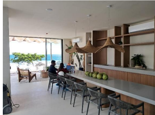
Finalización y amueblado de áreas social 1