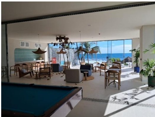
Finalización y amueblado de área Sala 2