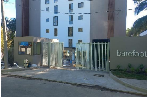
Finalización de caseta e instalación de portón principal

Se deberá anexas ilustraciones fotográficas del avance de obra y el programa de trabajo durante el período.