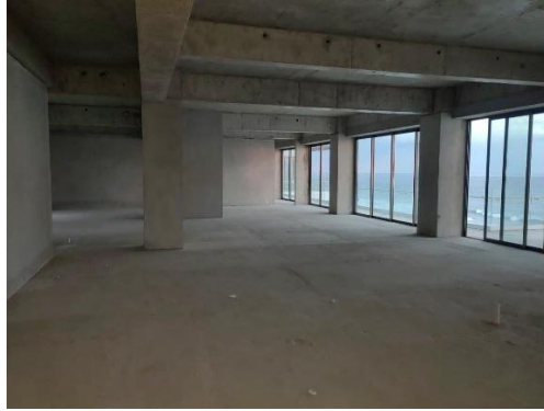
Finalización de nivel 6