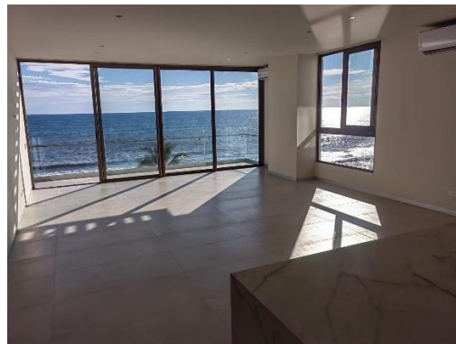
Finalización de apartamentos de nivel 4