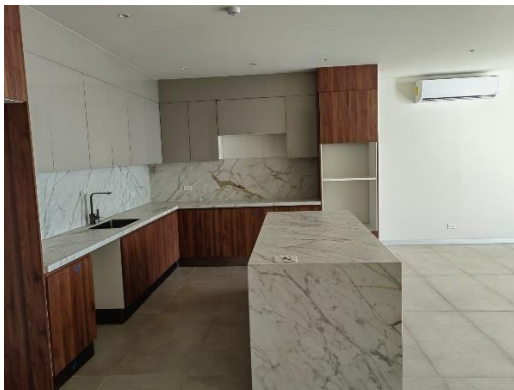
Finalización de apartamentos de nivel 5