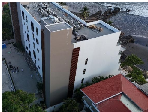
Aplicación de pintura en fachada poniente.