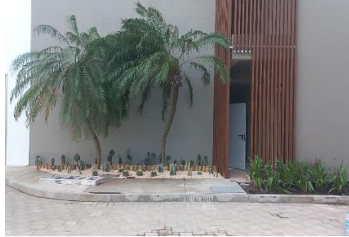
Inicio de jardinización