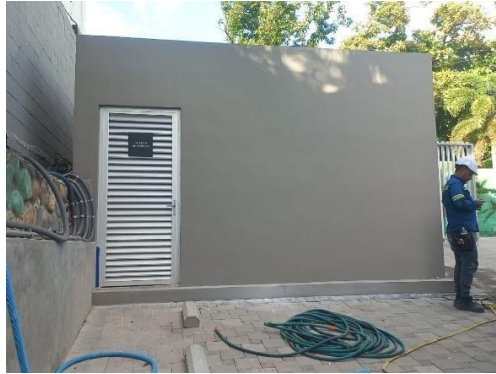
Finalización de cuarto de bombas