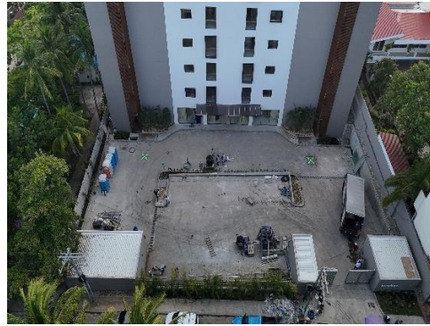
Finalización de parqueo