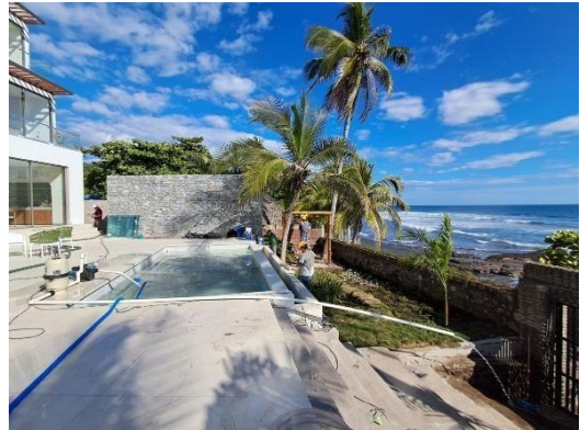
Finalización de jardinería en área de piscinas