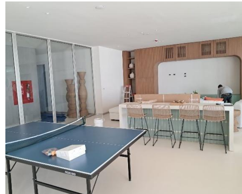
Finalización y amueblado de área de Juegos