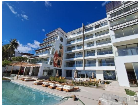
Finalización de pintura en facha sur y áreas de terrazas