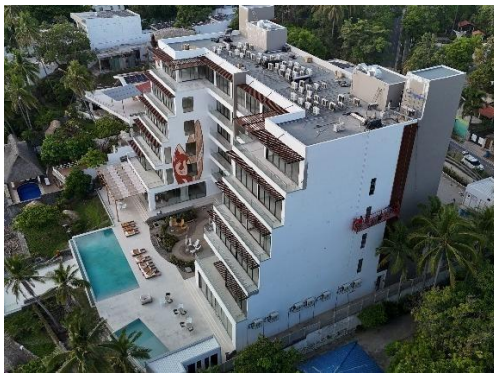
Resanes y pintura en fachada oriente