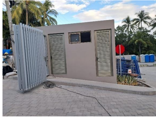
Finalización de caseta