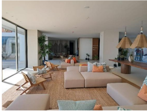
finalización de áreas de lobby Lounge