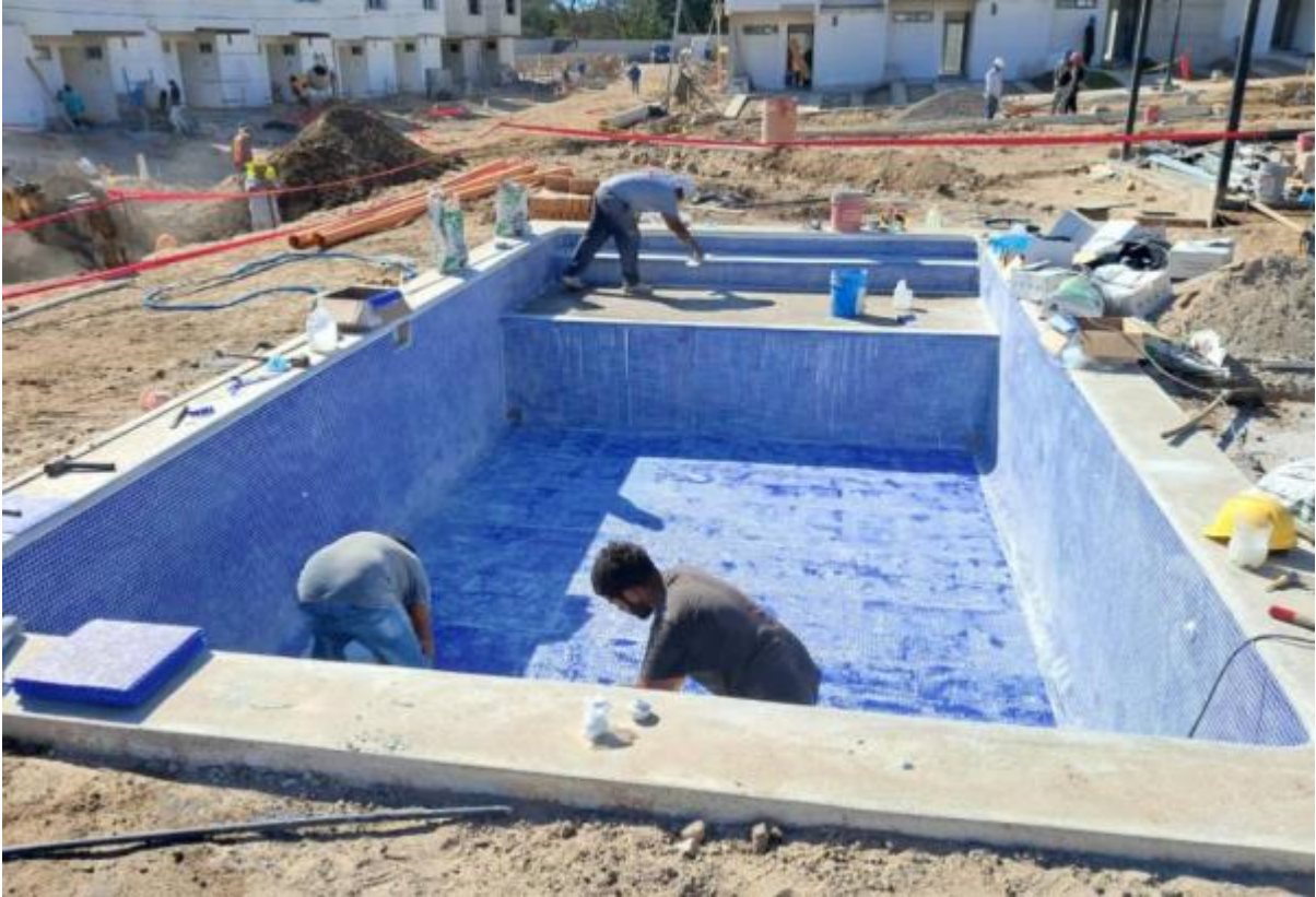
Ilustración Construcción De Piscina