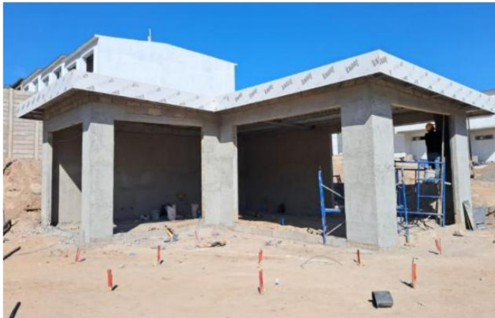
Ilustración Casa Club