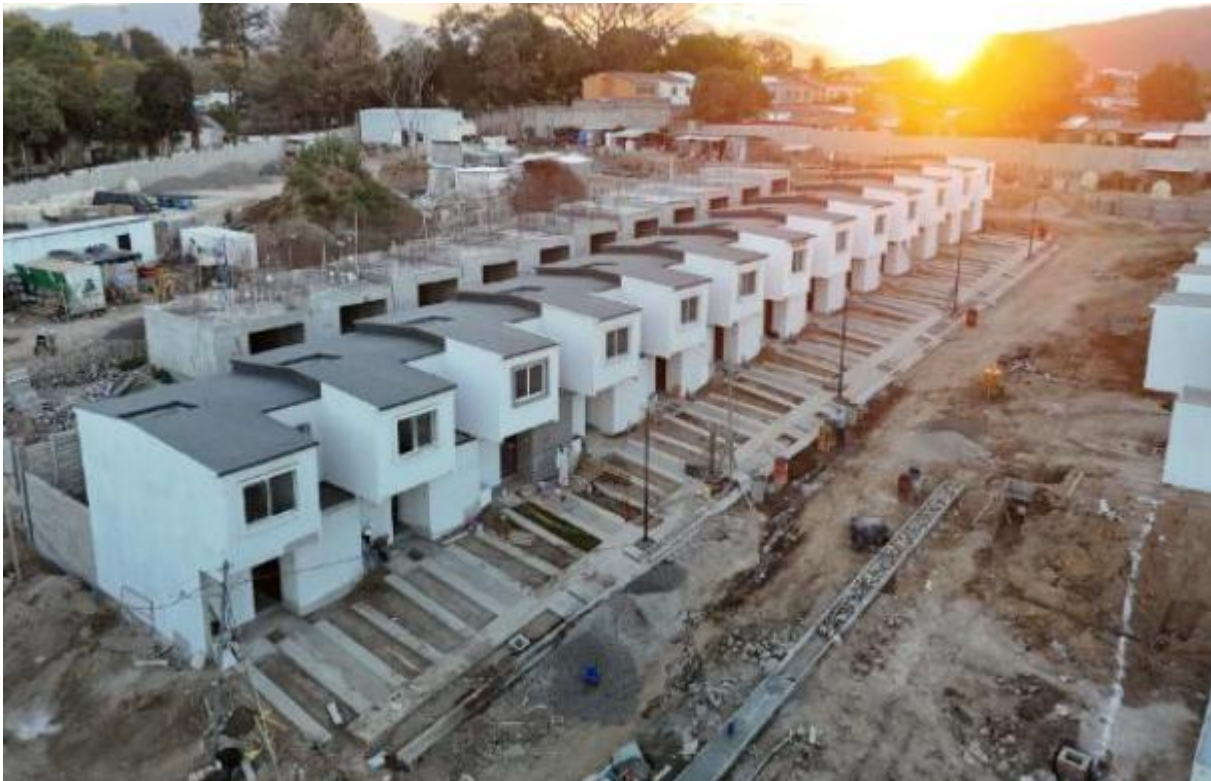
Avance GRUPO 1