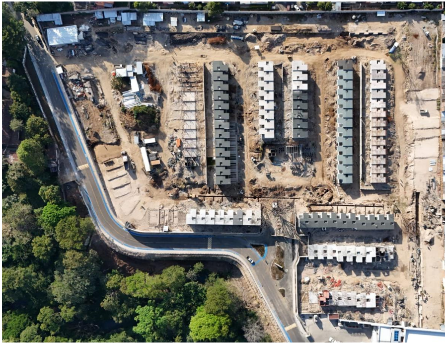
Ilustración 1 Vista panorámica Los Senderos Santa Ana

Se deberá anexar ilustraciones fotográficas del avance de obra y el programa de trabajo durante el período.