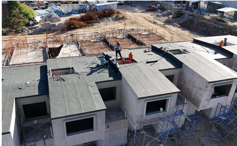
impermeabilización de losas de techo