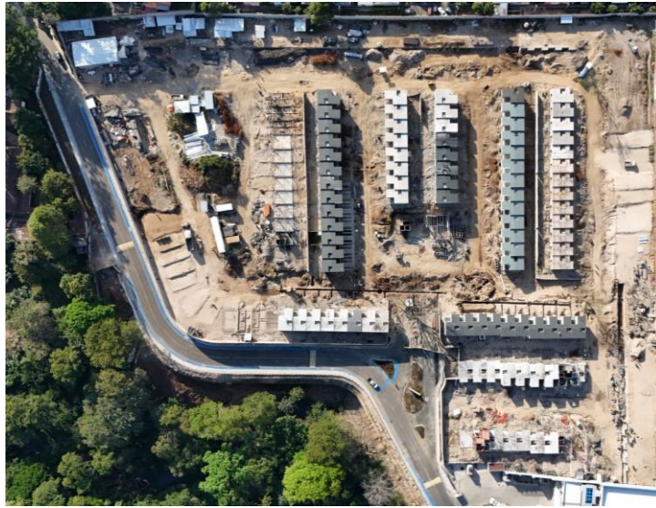
Ilustración 1 Vista panoramica Los Senderos Santa Ana

Se deberá anexar ilustraciones fotográficas del avance de obra y el programa de trabajo durante el período.