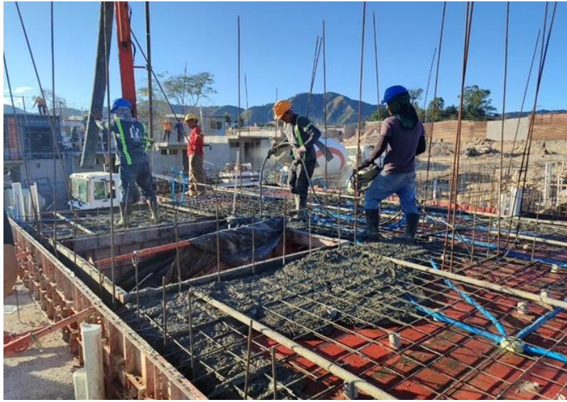
Moldeado para colado de vivienda