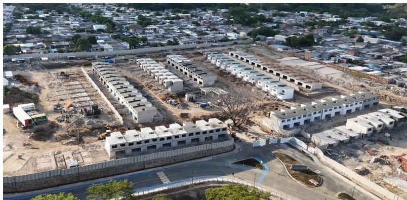
Ilustración Tomas Aereas