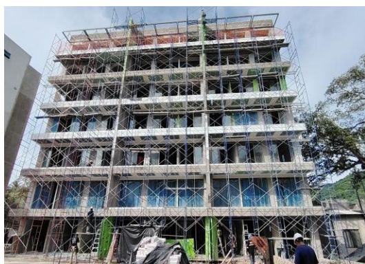
Acabados de fascias principales