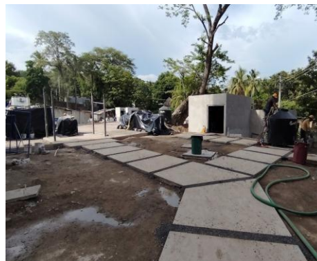
Construcción de accesos