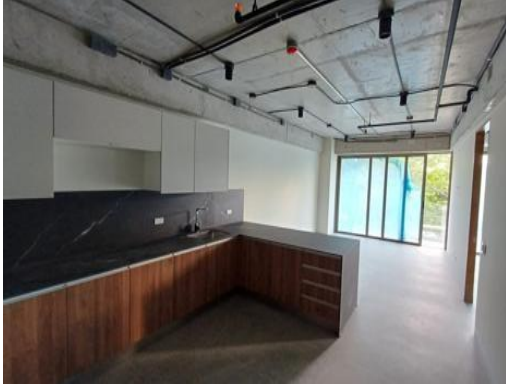
Finalización de apartamentos