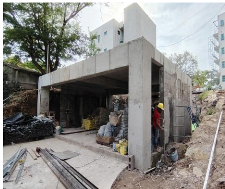
Acabados de área social

Se deberá anexar ilustraciones fotográficas del avance de obra y el programa de trabajo durante el período.