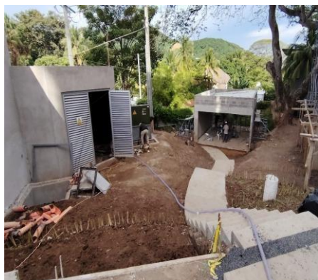
Zona de cuartos operativos