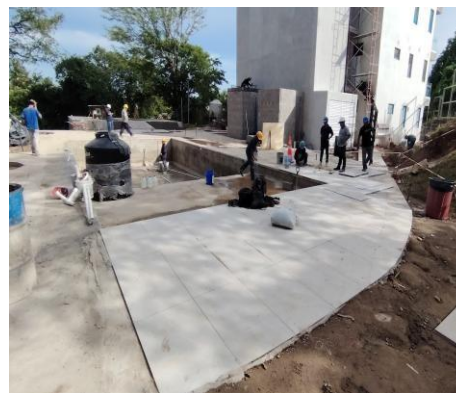
Acabados en área de piscina