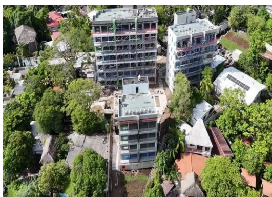
Vista área de Zonset