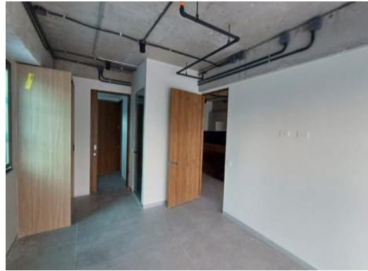
Instalación de muebles en apartamentos